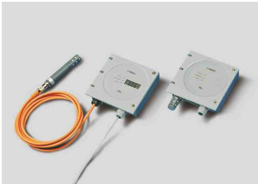
GMT220变送器 - 用于恶劣、潮湿的环境。